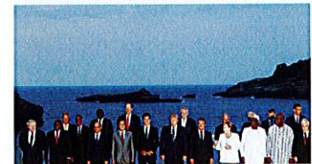
「家族の絆」実感したG7首脳 同じ位ればその決裂回避