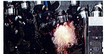
香港、実弾発砲の次に起きること 藤本