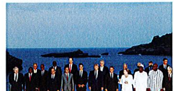
「家族の絆」実感したG7首脳 同じ心ればこそその決裂回避