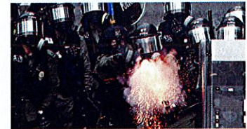
香港、実弾発砲の次に起きること 藤本